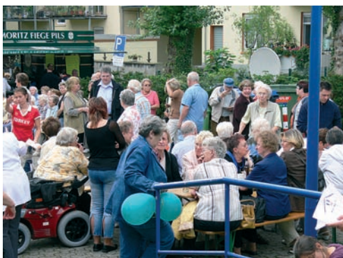
15 Jahre Haus der Begegnung: ein Fest sorgt für bleibende Eindrücke S. 11