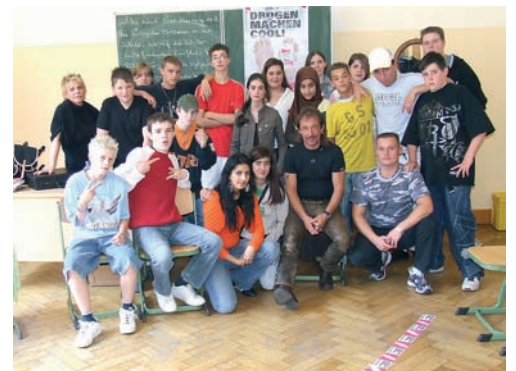
Eine Sucht- Selbsthilfegruppe engagiert sich: Prävention S. 6/7