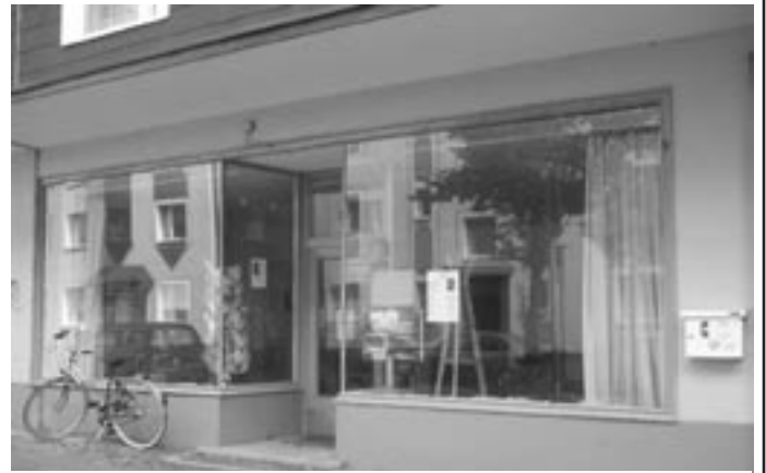
Das FGZ in der Alsenstraße

In den 70er und 80er Jahren entstanden Frauengesundheitszentren aus der Kritik an der medizinischen Gesundheitsversorgung speziell an der Gynäkologie. Das Beratungskonzept beruht auf dem Prinzip der Hilfe zur Selbsthilfe. Daher möchten wir ein Beratungs-, Bildungs- und Kursangebot anbieten, das speziell auf die Bedürfnisse von Frauen abgestimmt ist und eine Alternative oder Ergänzung zum existierenden Gesundheitswesen bildet. Unser Ziel ist es, Frauen mehr Eigenkompetenzen zu verschaffen, um ihr Selbstvertrauen und ihre Handlungsmöglichkeiten zu stärken.